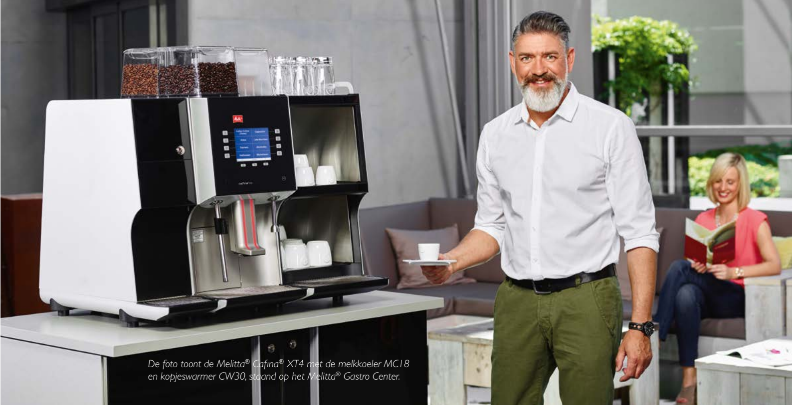
De foto toont de Melitta® Cafina® XT4 met de melkkoeler MC18 en kopjeswarmer CW30, staand op het Melitta® Gastro Center.